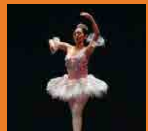
Festivales y Conciertos