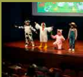
Obras de Teatro