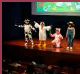
Obras de Teatro