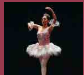
Festivales y Conciertos